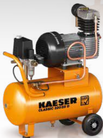
Рис.: CLASSIC 320/25 D