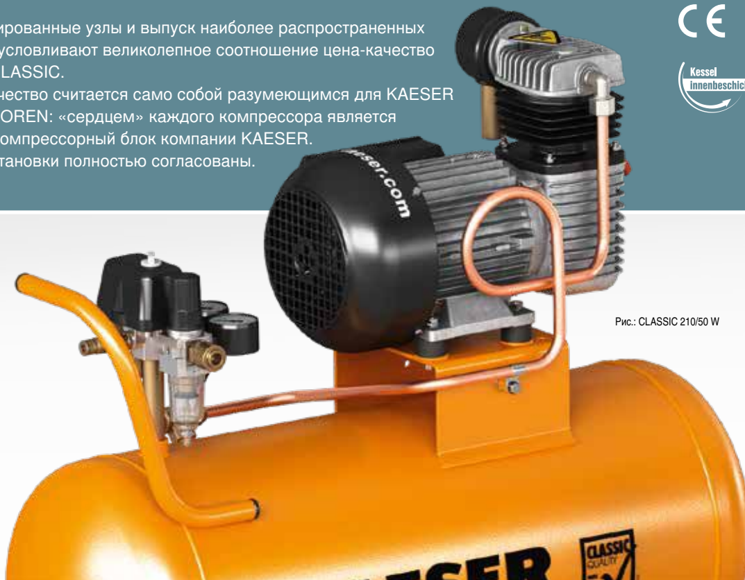
Рис.: CLASSIC 210/50 W