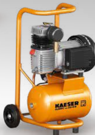
Рис.: CLASSIC mini 210/10 W