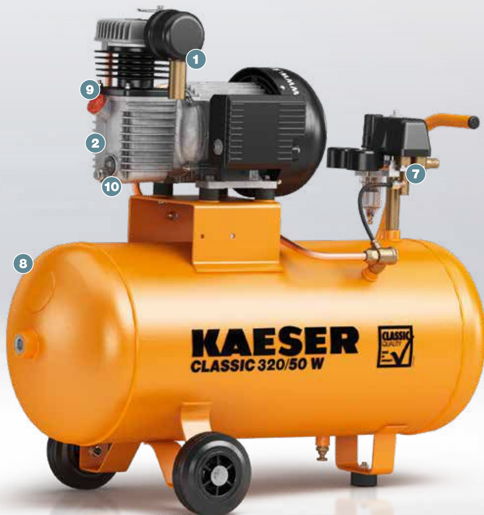
Рис.: CLASSIC 320/50 W