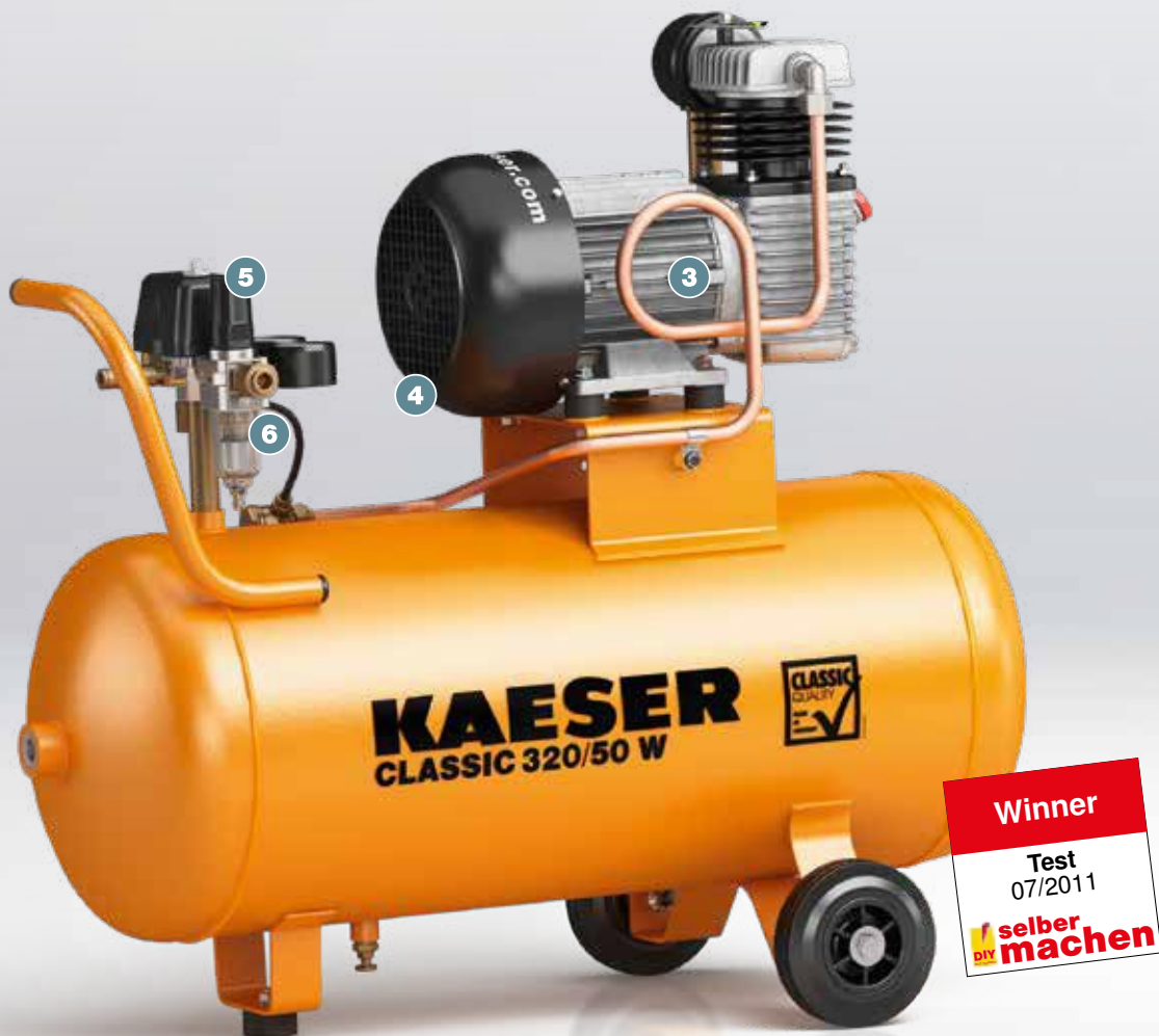
Рис.: CLASSIC 320/50 W