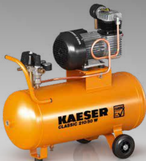
Рис.: CLASSIC 210/50 W